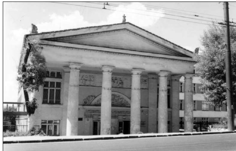
Старый корпус ИМИ сегодня

Десятилетия минули с тех пор. Ижевский механический институт получил статус Ижевского государственного технического университета имени М.Т. Калашникова, вырос в один из крупнейших технических вузов страны с мощной инфраструктурой. Сегодня в структуре университета 15 факультетов, 2 научно-исследовательских института, 15 научно-производственных подразделений