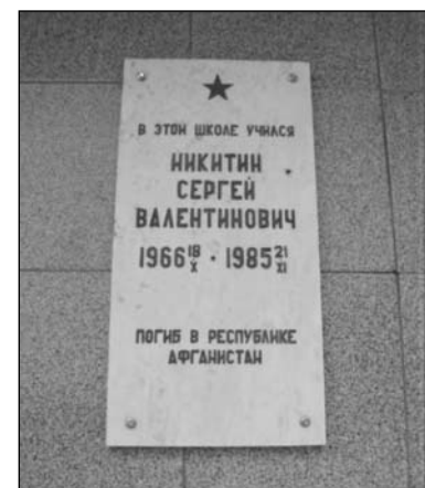
Мемориальная доска на фасаде школы